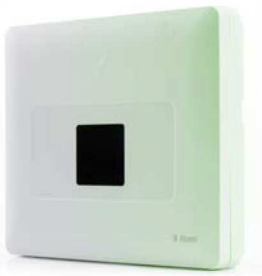
PowerMaster-33 EXP G2 Distributed wireless alarm