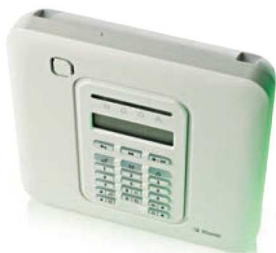
PowerMaster-10 Triple G2 30-zone control panel